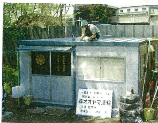
ユニット屋根施工