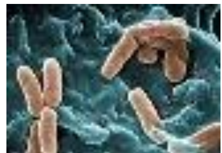
緑 膿 菌