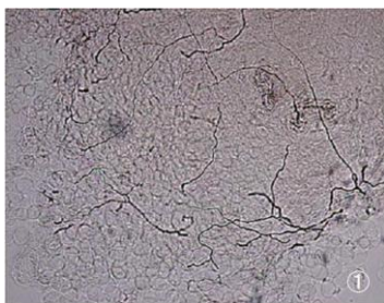
白 癬 菌